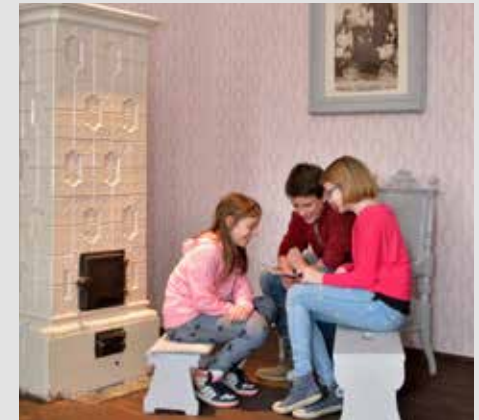
Schiele Wohnung am Bahnhof mit originalem Kachelofen

bis 26. Oktober Ermäßigter Eintritt mit Egon Schiele Museum-Ticket täglich 9:00 bis 18:00 Uhr diegartentulln.at