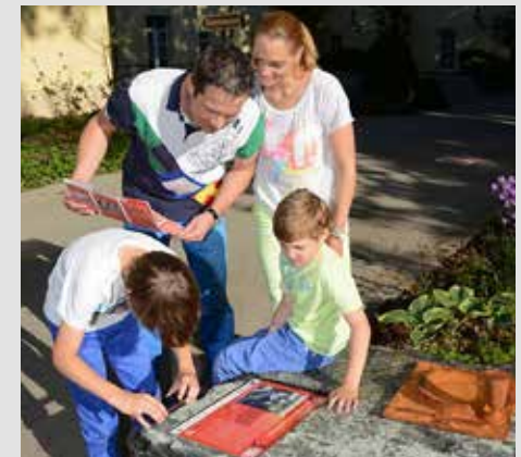
Schiele Weg Station