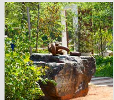
Egon Schiele Garten auf der Garten Tulln