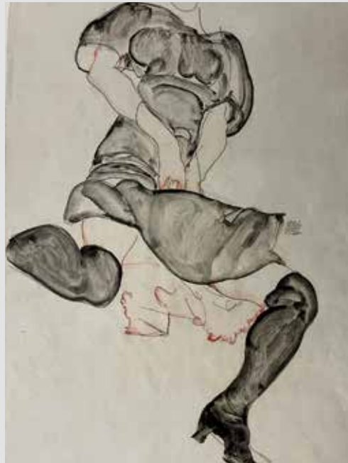
Egon Schiele, Frau mit schwarzen Strümpfen, 1912, Privatbesitz