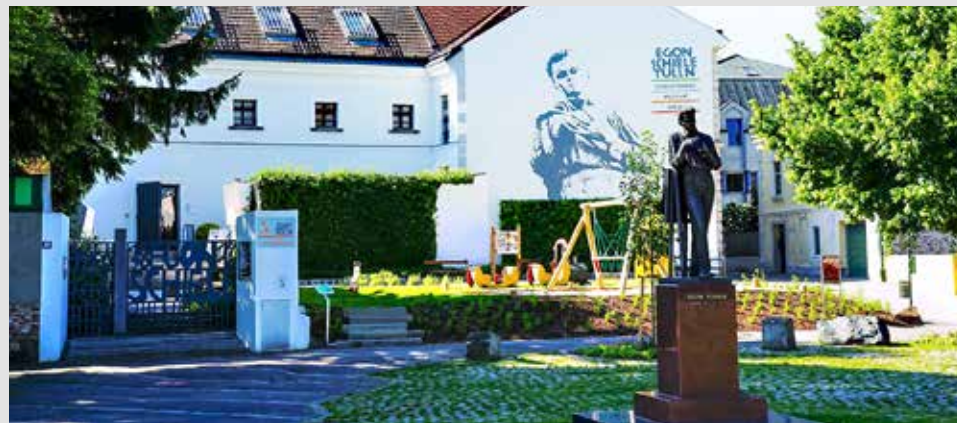
Egon Schiele Museum Tulln, Donaulände 28