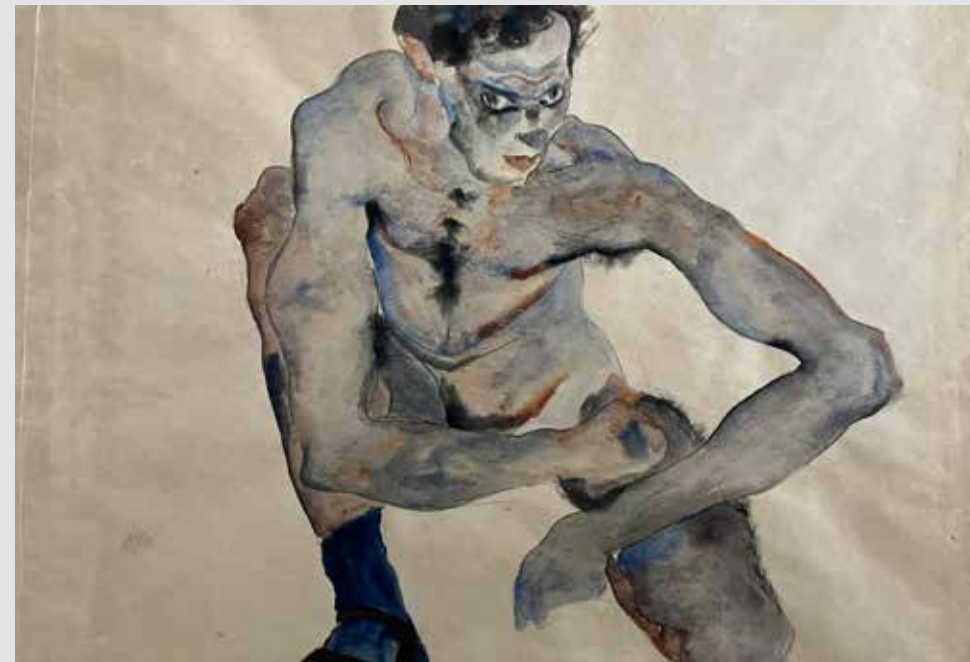
Egon Schiele, Hockender männlicher Akt mit blauem Strumpf, 1912, Privatbesitz